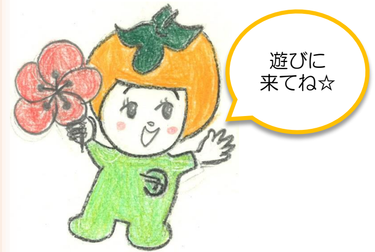
五條市マスコットキャラクター 「カッキー」