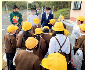
小中合同クリーン活動

多様な体験・奉仕活動を通して、他者への共感、社会の一員としての自覚、社会に役立つことへの喜びなどを学びます。