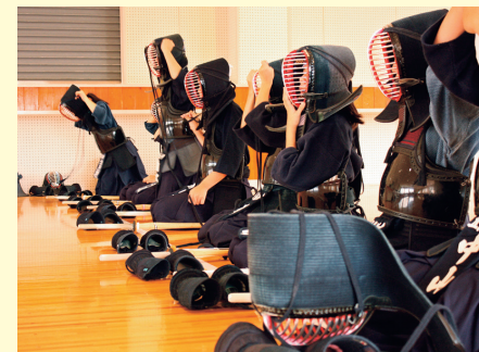
クラブ活動の推奨