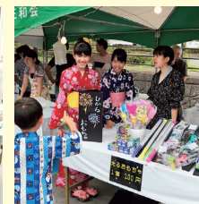
まきの DE 盆踊り