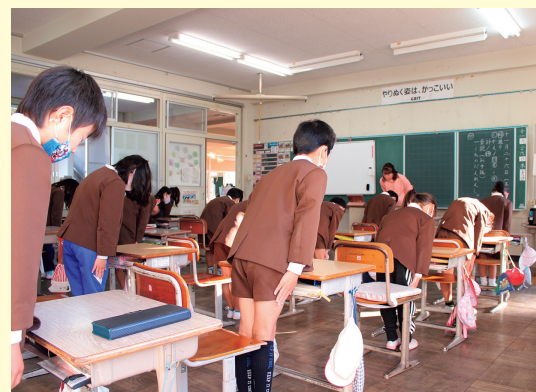
授業の始めと終わりの挨拶を通して体幹を鍛える（体幹強化プログラム）

体幹を鍛え正しい姿勢を保つ能力を高めることで、 基礎体力が向上して身体活動量を増加させるとともに、 心と体の健やかな成長を図ります。