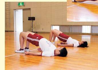
運動を通して体幹を鍛える（体幹強化プログラム）