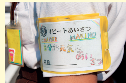
小中合同あいさつ運動