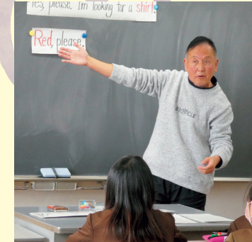
中学校教員による授業